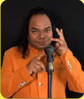
शम्भू शिखर (नई दिल्ली)

कार्यकारिणी समिति की बैठक में लिए गए निर्णय के अनुसार संस्था के सदस्यगणों एवं उनके परिजनों हेतु “दीपावली मिलन समारोह-2023” के अन्तर्गत दिनांक 19 दिसम्बर, 23 को ‘कवि सम्मेलन’ का आयोजन, रंगमहल गार्डन में रात्रि 8.00 बजे से किया गया है। साथ ही ‘स्वरुचि भोज’ सायं 7.00 बजे से आयोजित है। कवि सम्मेलन में आमंत्रित कविगण निम्नानुसार हैं :-